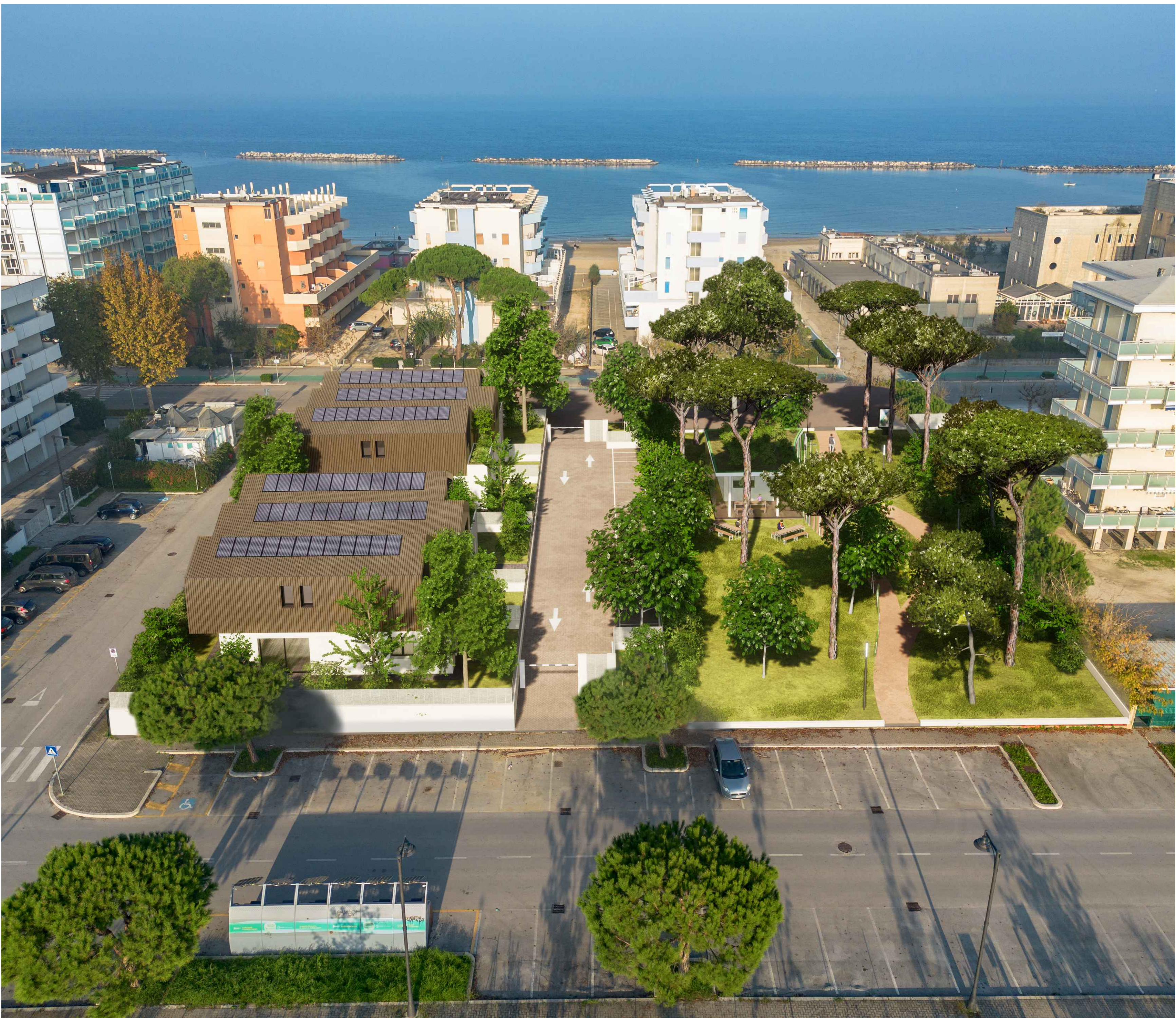
Fotoinserimento vista aerea